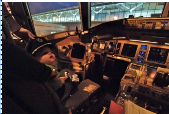
Judah mocht even in de cockpit zitten

Sinds 19 november zijn we weer op Nederlandse bodem. Grappig om te zien dat we zelfs weer moeten wennen aan ons eigen land; smalle wegen, een kleine koelkast, ander geld, snackbars en regen in december. We zijn blij in Nederland te zijn, met de mogelijkheid om iedereen weer in levende lijve te kunnen ontmoeten!