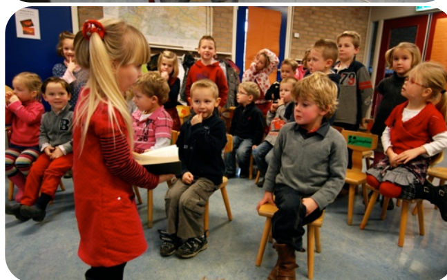
Naspelen MAF filmpje in Waarde