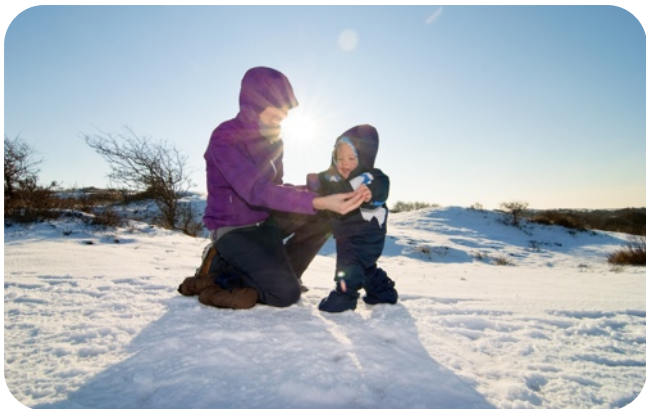
Genieten van het mooie weer en sneeuw in de duinen

De laatste paar weken van maart hebben we zoveel mogelijk zaken geregeld voor vertrek naar Angola (ondanks dat dit waarschijnlijk nog wel een jaartje duurt). Zo hebben we onze spullen uitgezocht, visumzaken gestart, financiële zaken, verzekeringen, medische keuringen ingepland en uitgezocht welke inentingen we nodig hebben en wanneer we die moeten krijgen.