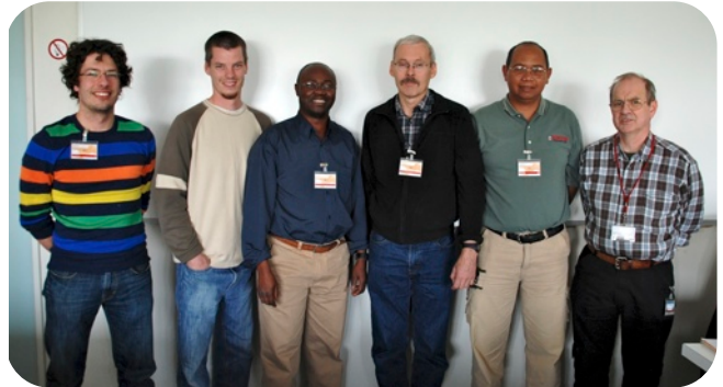
Het internationale MAF team uit Madagaskar, Angola, Tsjaad en Nederland